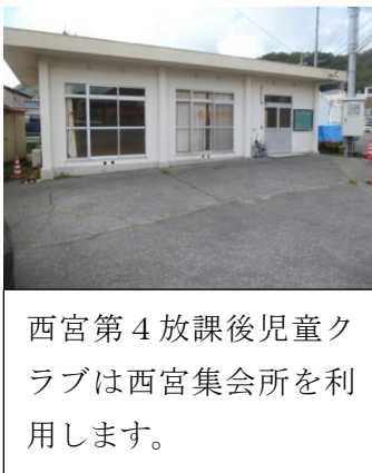
西宮第4放課後児童クラブは西宮集会所を利用します。

メモ … 西小学校区内に西宮第4放課後児童クラブ(定員30名)を西宮集会所に新設。