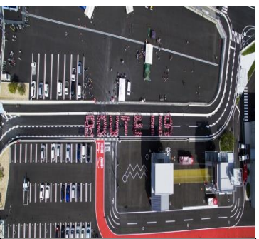
市道宮浦119号線開 通式典で作られた人文字 「ROUTE 119」

宮浦1丁目に新消防本庁舎建設工事と併せて敷地を縦断するよう築造した道路を認定するものです。路線番号は宮浦119号線です。