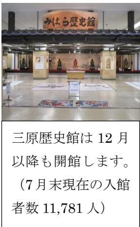
三原歴史館は12月以降も開館します。(7月末現在の入館者数11,781人)

メモ … 駅前前に設置している三原歴史館(当初11月まで)を12月以降も開館します。