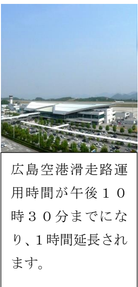
広島空港滑走路運用時間が午後10時30分までになり、1時間延長されます。

広島空港滑走路運用時間延長協定による周辺地域の環境整備事業等に要する経費の財源に充てられるよう改正します。収入財源は県交付金等です。