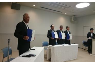
9月1日の広島空港滑走路運用時間延長に伴う協定書調印式(左側から：仁ノ岡市議長・天満市長・重田船木連合町内会長・高垣県副知事)

メモ … 滑走路運用時間延長に伴う協定に基づき、空港周辺対策事業が実施されます。